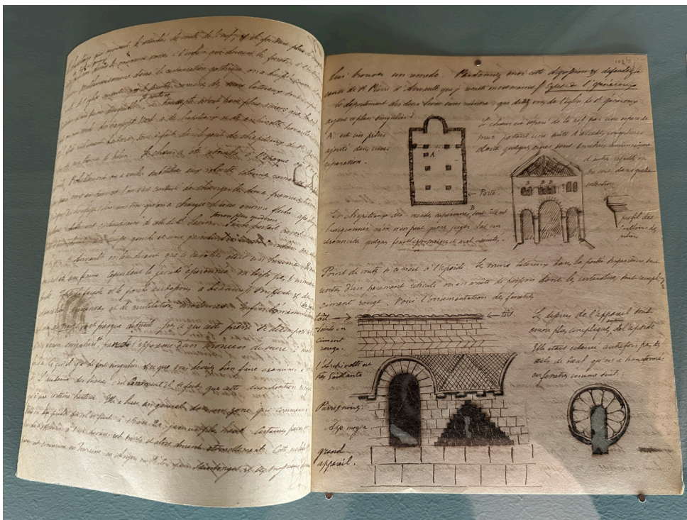
Prosper Mérimée, Lettre au préfet de la Vienne concernant l'église Saint-Généroux (Deux-Sèvres) , 23 juillet 1840, encre sur papier, Charenton-le-Pont, Médiathèque du patrimoine et de la photographie, inv. C/80/14/1-109 bis